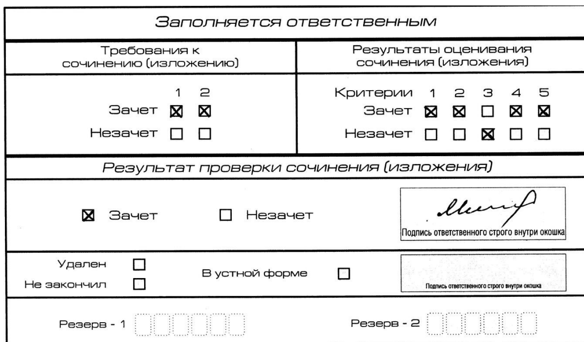
Рис. 10. Область для оценки работы

3. Во всех остальных случаях итоговое сочинение (изложение) проверяется по всем пяти критериям и оценивается по системе «зачет»/«незачет».